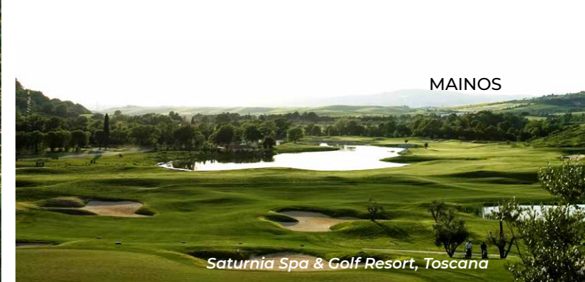
Saturnia Spa & Golf Resort, Toscana