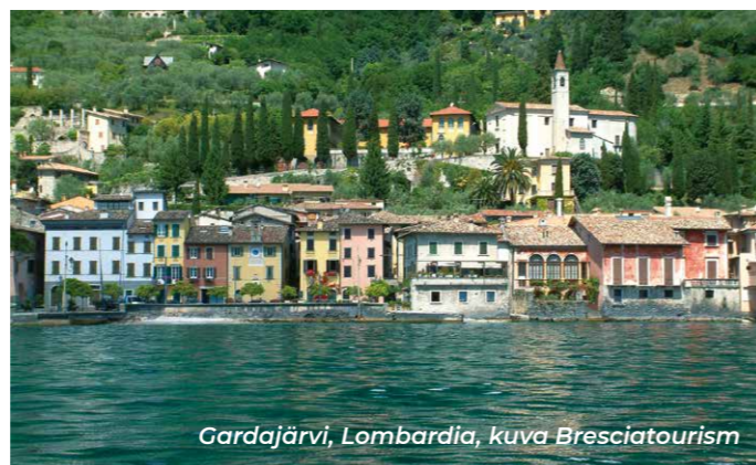
Gardajärvi, Lombardia