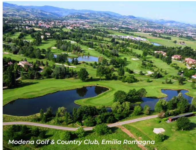
Modena Golf & Country Club, Emilia Romagna