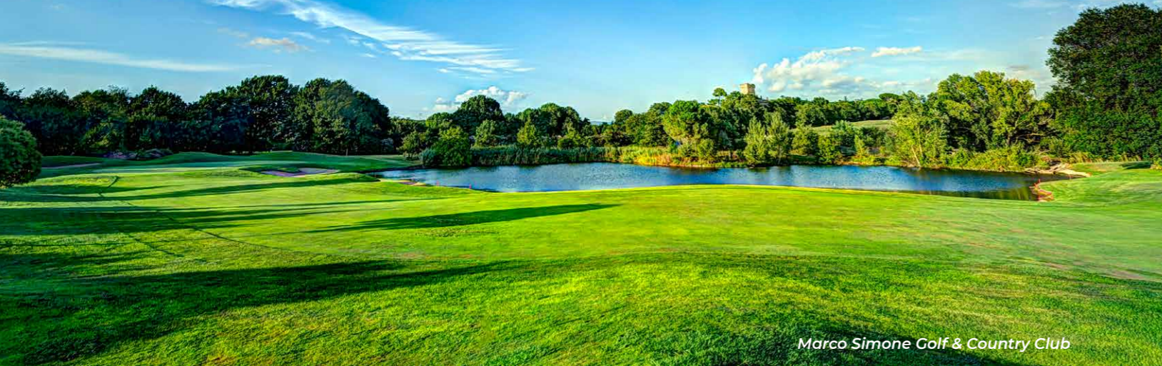
Marco Simone Golf & Country Club

Italia on kehittynyt upeaksi golfmaaksi, jossa on laaja tarjonta. Nyt esittelemme pohjoisesta etelään tärkeimmät golfkohteet, arvostetuimmat kentät, pitkät golfperinteet ja kiinnostavat uudet vaihtoehdot. Italy Golf & More -palvelun avulla suunnittelet unelmiesi golfoman.