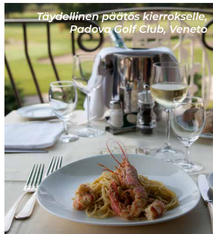
Täydellinen päätös kierrokselle, Padova Golf Club, Veneto

Pohjoisempana avautuu prosecco-seutu, jolla kannattaa