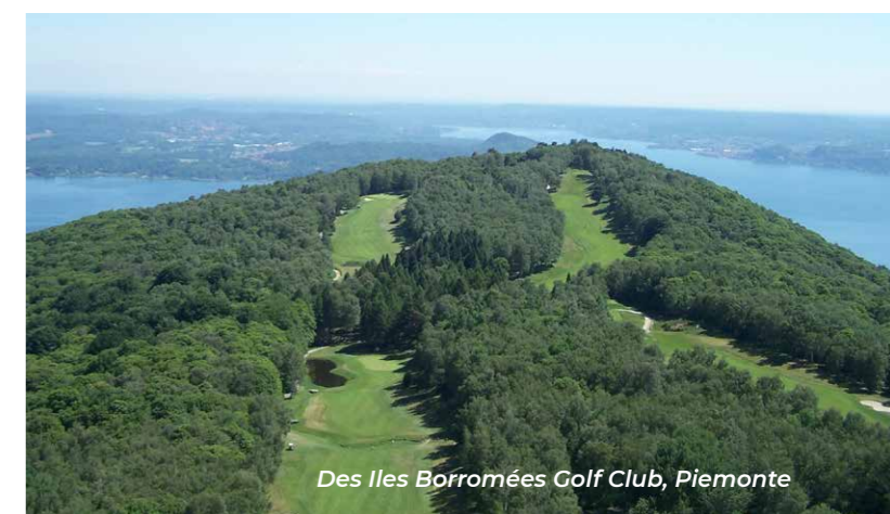
Des Iles Borromées Golf Club, Piemonte

ruunapuut ja oliivilehdot todistavat ihanasta välimerellisestä ilmastosta. Täällä on kokonainen rivistö kansainvälisesti korkealuokkaisia golfkohteita, kuten kauniissa maisemissa sijaitseva Arzaga Golf Club. Alueella toimii myös moninkertaisesti palkittu Chervò Golf Hotel Spa & Resort, jossa voi rentoutua ylellisessä kylpylässä ja nautiskella paikallisen keittiön antimista. 110 hehtaarin alueelle levittäytyvällä Gardagolf Country Clubin kentällä on 27 reikää Valtenesin kumpuilevassa maastossa linnoitusten ja linnojen välissä. Gagnanon korkeuksissa sijaitseva Golf Club Bogliaco on erittäin suosittu, ja Franciacorta Golf Clubin kentällä saat lähituntumaa viinitarhoihin, jotka tuottavat laadukasta kuplivaa pieneä, mutta ihastuttavan Iseojärven lähistöllä.