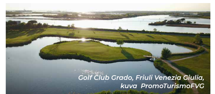
Golf Club Grado, Friuli Venezia Giulia

on aina lähellä tarjoamassa mukavasti haastetta.