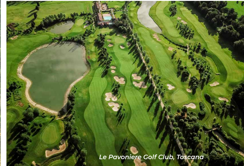
Le Pavoniere Golf Club, Toscana