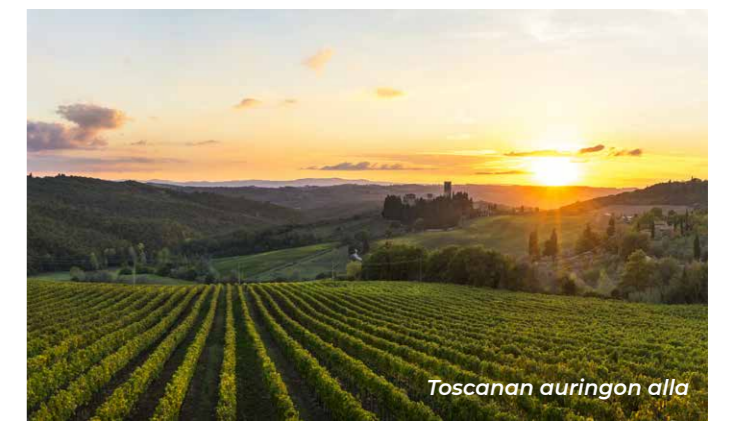
Toscanan auringon alla

Jos mielit golfauksen lomassa leikottelemaan hiekkarannalle, hyviä vaihtoehtoja ovat Cosmopolitan Resort, Versilia Golf Forte dei Marmi ja Punta Ala.