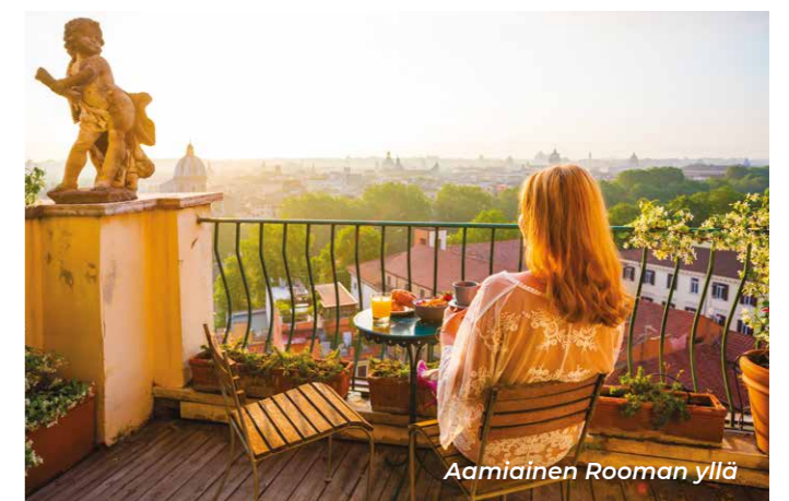
Aamiainen Rooman yllä

Tarquinia Country Clubin 9-reikäisellä kentällä.