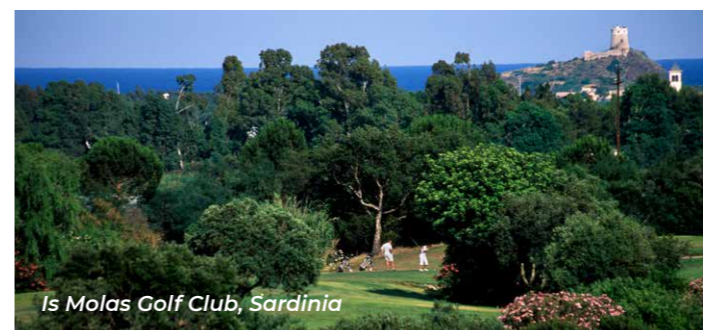
Is Molas Golf Club, Sardinia