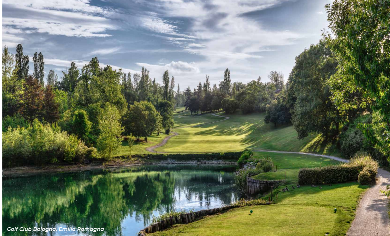
Golf Club Bologna, Emilia Romagna

Jos olet intohimoinen autojen, moottoripyörien ja designin harrastaja, olet oikeassa paikassa: sisämaata kutsutaan myös nimellä "the Motor Valley", ja siellä ovat niin Ferrarin, Ducatin, Lamborghinin kuin Maseratin juuret. Alueella on myös paljon upeita museoita.