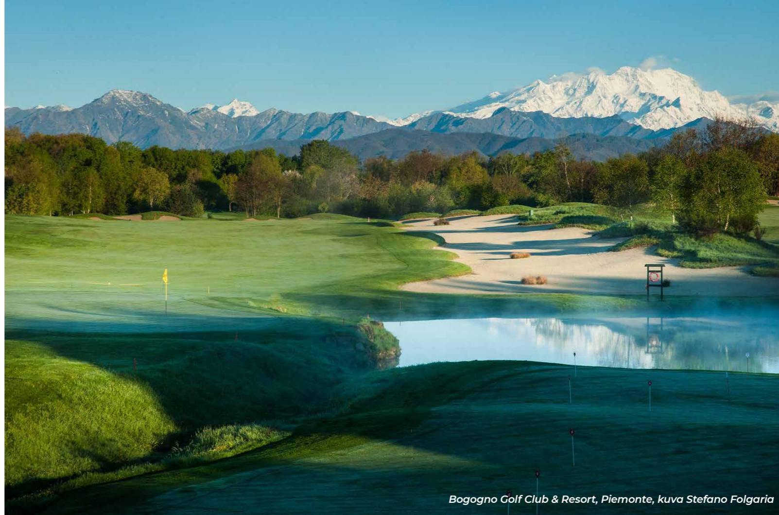
Bogogno Golf Club & Resort, Piemonte

Piemonte on gastronomian mekka. Alueella toimii 46 Michelin-kokkia, joten golfomalta ei tarvitse lähteä tyhjin vatsoin. Esimerkiksi syyskuukausina pääsee nauttimaan valkoisen tryffelin ihanasta tuoksusta.