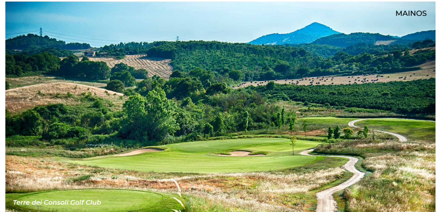
Terre dei Consoli Golf Club

Jo vuonna 1903 perustettu Roma Acquasanta on klassisen hieno 18-reikäinen kenttä, joka on myös Italian vanhin. Sil-