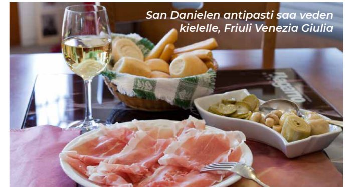
San Danielen antipasti saa veden kielelle, Friuli Venezia Giulia

Aloitetaan rannikolta, jolla Golf Club Gradon kenttä levittäytyy 60 hehtaarin alalle laguunin ympäristöön Tenuta Primeron lomakohteen läheisyydessä. Aluetta halkovissa vesissä viihtyvät haikarat, joutsenet, flamingot ja monet muut lajit. Hieman kauempana pitkällä hiekkarannoilla päivää paistattelevat kaikenikäiset turistit, ja Gradon kalastajakylän viehättävä keskusta henkii lomatumnelmaa. Golfajaille vesi