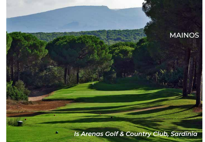
Is Arenas Golf &amp; Country Club, Sardinia