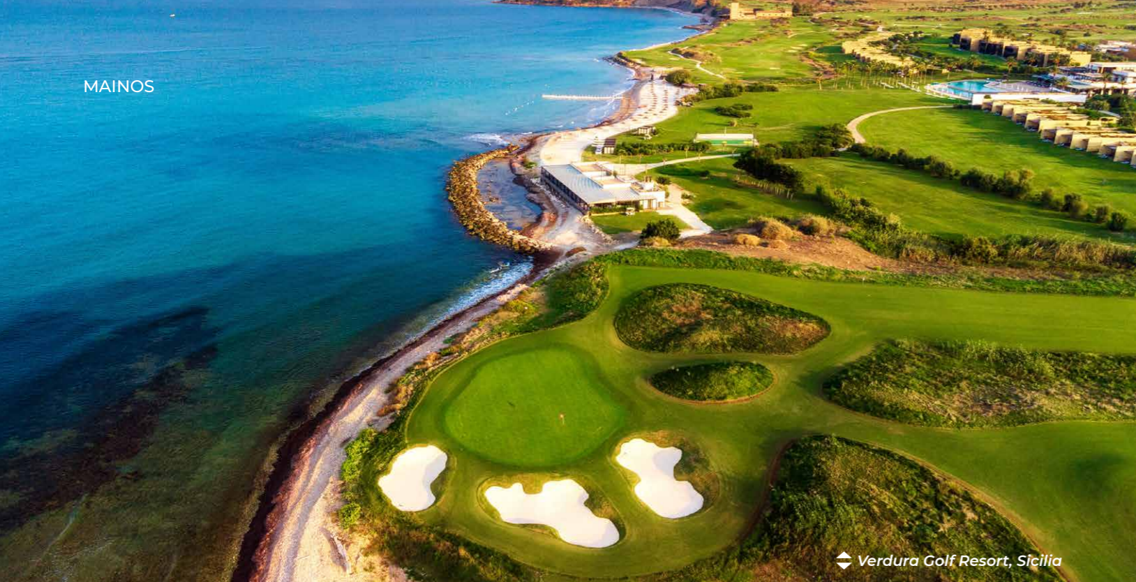
Verdura Golf Resort, Sicilia