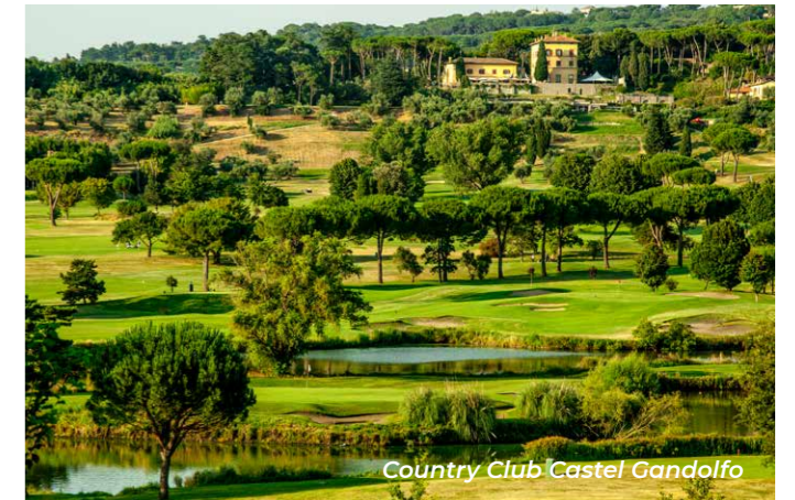
Country Club Castel Gandolfo

Viterbon ulkopuolella on myös Italian golfliiton virallinen kotikenttä Golf Nazionale, jolla on järjestetty useita arvokilpailuja. Väylät kulkevat satavuotisten tammien varjossa. Mestariarkkitehdit Fazio ja Mezzacane ovat lyöneet leimansa tännekin. Jos kaipaat meri-ilman tuoksuhaudusta, poikkea