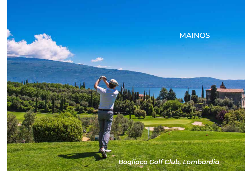
Bogliaco Golf Club, Lombardia

Hieman kauempana idässä on Gardajärvi, jonka leudossa mikroilmastossa pääsee golfaamaan ympäri vuoden. Sit-