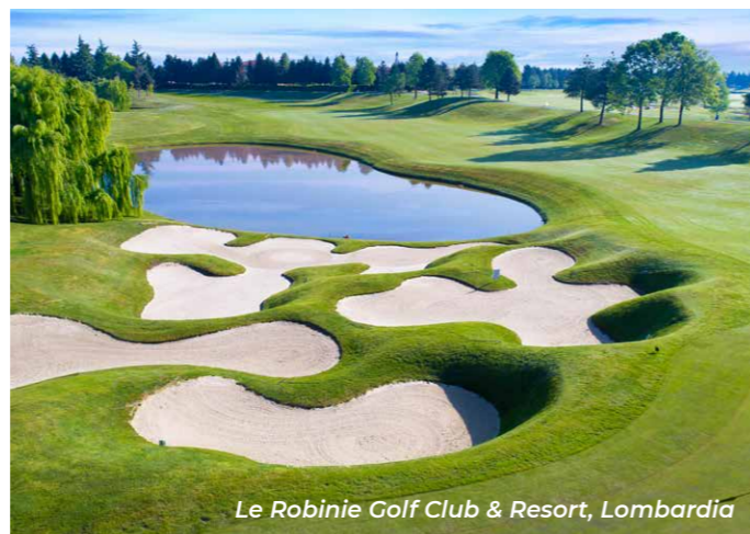
Le Robinie Golf Club & Resort, Lombardia