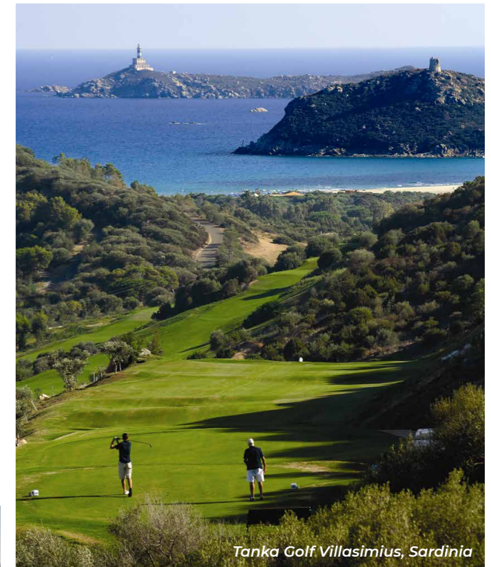
Tanka Golf Villasimius, Sardinia