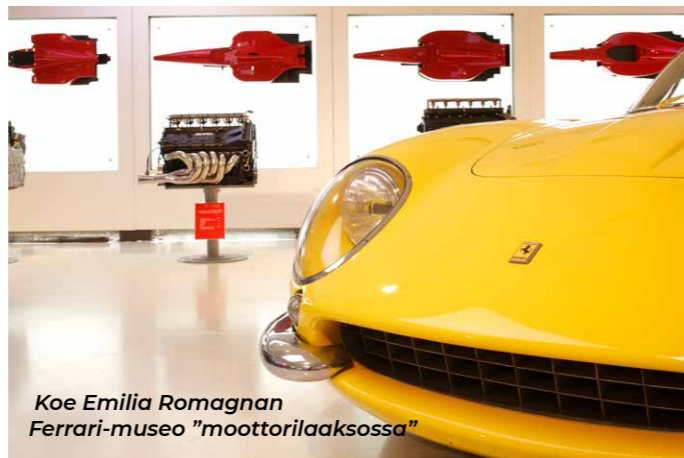
Koe Emilia Romagnan Ferrari-museo "moottorilaaksossa"