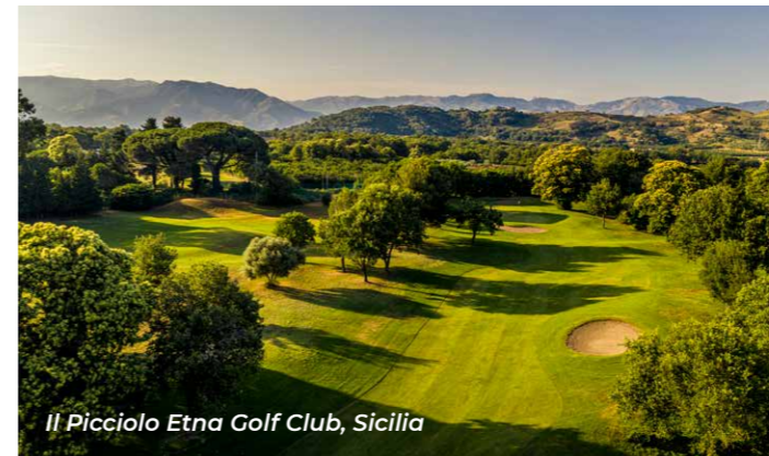
Il Picciolo Etna Golf Club, Sicilia

Ylhäällä koillisessa ylellisen Costa Smeraldan lähistöllä on puolestaan Pevero Golf Club, joka houkuttelee korkealla teknisellä tasollaan ja tarjoaa mukavasti haastetta myös niille, joilla on pieni tasoitus.